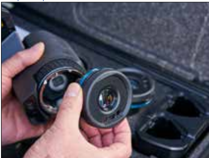
Utilisez vos objectifs (du grand angle au téléobjectif) avec l'ensemble de vos caméras grâce à l'optique AutoCal™