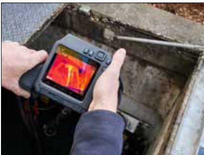
Le bloc optique rotatif à 180° et l'écran 4" lumineux rendent la série FLIR T500 facile à utiliser dans n'importe quel environnement