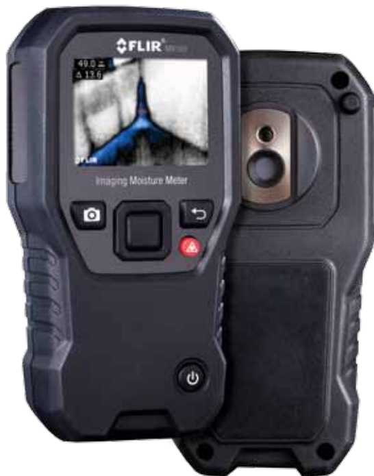
MR160 イメージングモイスチャーメーター