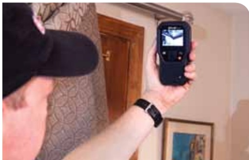
天井と壁の接続部の水分問題を調査