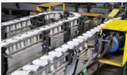
製造現場のモニタリング