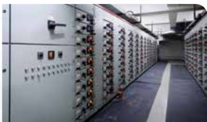
重要機器の継続的モニタリング

AX8は赤外線カメラと可視光デジタルカメラを搭載しながら、54×25×95mmのコンパクト設計で、スペースが限られた場所でも簡単に設置でき、重要電気機器や機械設備などを稼働したままで継続的に温度をモニタリングします。